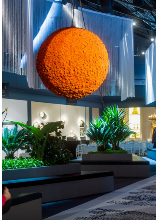
View @ BRAFA 2014